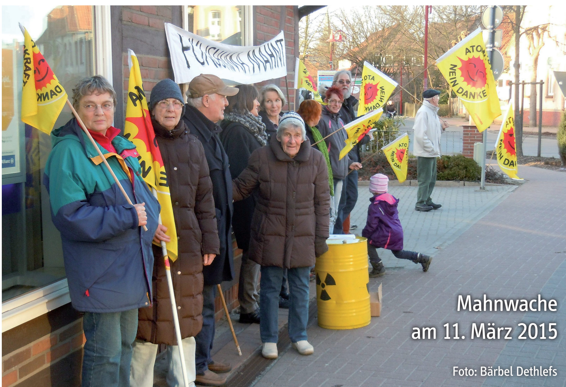
Mahnwache am 11. März 2015